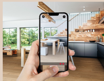
Foto af værelset

Trykt, digitalt eller tegnet (på side 5 kan du skitsere dit værelse med alle vigtige nøgledata)