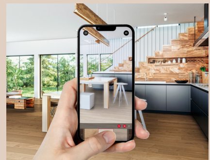
Photo de la pièce

Imprimé, numérique ou dessiné (à la page 5, vous pouvez esquisser votre espace avec toutes les données de référence importantes)