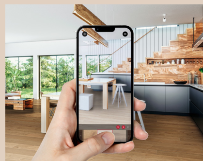
Foto della stanza

Stampato, digitale o disegnato (a pagina 5 potete fare uno schizzo della vostra camera con tutti i dati chiave più importanti)